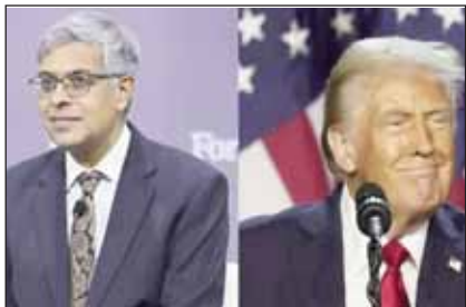
ਐੱਨਆਈਐੱਚ ਦੇ ਨਿਰਦੇਸ਼ਕ ਵਜੋਂ, ਡਾਕਟਰ ਜੈ ਭੱਟਾਚਾਰੀਆ 27 ਸੰਸਥਾਵਾਂ ਦੀ ਨਿਗਰਾਨੀ ਕਰਨਗੇ। ਇਹ ਸੰਸਥਾਵਾਂ ਟੀਕੇ ਤਿਆਰ ਕਰਨ

ਵਾਸ਼ਿੰਗਟਨ, 27 ਨਵੰਬਰ (ਪੋਸਟ ਬਿਊਰੋ): ਅਮਰੀਕਾ 'ਚ ਨਵੇਂ ਚੁਣੇ ਗਏ ਰਾਸ਼ਟਰਪਤੀ ਡੋਨਾਲਡ ਟਰੰਪ ਆਪਣੀ ਸਰਕਾਰ ਲਈ ਅਹਿਮ ਅਹੁਦਿਆਂ 'ਤੇ ਨਿਯੁਕਤੀ ਕਰ ਰਹੇ ਹਨ। ਭਾਰਤੀ ਮੂਲ ਦੇ ਕੁਝ ਲੋਕਾਂ ਨੂੰ ਵੀ ਇਸ ਵਿੱਚ ਥਾਂ ਮਿਲੀ ਹੈ। ਟਰੰਪ ਨੇ ਭਾਰਤੀ ਮੂਲ ਦੇ ਡਾਕਟਰ ਅਤੇ ਅਰਥ ਸ਼ਾਸਤਰੀ ਡਾਕਟਰ ਜੈ ਭੱਟਾਚਾਰੀਆ ਨੂੰ ਨੈਸ਼ਨਲ ਇਸਟੀਮੇਟਿਊਟ ਆਫ ਹੈਲਥ (ਐੱਨਆਈਐੱਚ) ਦਾ ਡਾਇਰੈਕਟਰ ਨਿਯੁਕਤ ਕਰਨ ਦਾ ਫੈਸਲਾ ਕੀਤਾ ਹੈ। ਜੈ ਭੱਟਾਚਾਰੀਆ ਦੇਸ਼ ਦੇ ਪ੍ਰਮੁੱਖ ਮੈਡੀਕਲ ਖੋਜ ਸੰਸਥਾਨ ਦੀ ਜ਼ਿੰਮੇਵਾਰੀ ਸੰਭਾਲਣਗੇ।