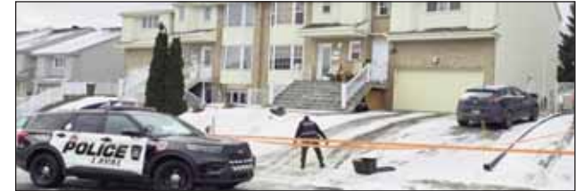
ਨੂੰ ਕੰਪਲੈਕਸ 'ਚੋਂ ਬਾਹਰ ਨਿਕਲਦੇ ਵੇਖਿਆ ਗਿਆ। ਹਾਲੇ ਤੱਕ ਕੋਈ ਗਿਰਫਤਾਰੀ ਨਹੀਂ ਹੋਈ ਹੈ ਅਤੇ ਕਿਸੇ ਦੇ ਜ਼ਖਮੀ ਹੋਣ ਦੀ ਸੂਚਨਾ ਨਹੀਂ ਹੈ। ਲਾਵਲ ਪੁਲਿਸ ਨੇ ਜਾਂਚਕਰਤਾਵਾਂ ਨੂੰ ਆਪਣਾ ਕੰਮ ਕਰਨ ਦੀ ਆਗਿਆ ਦੇਣ ਲਈ ਇਲਾਕੇ ਵਿੱਚ ਇੱਕ ਸੁਰੱਖਿਆ ਘੇਰਾ ਬਣਾਇਆ ਹੈ।

ਫੌਰਸ ਨੂੰ ਸੋਟ-ਮਾਰਟਿਨ ਬੁਲੇਵਾਰਡ ਟੌਰੇਨ ਸਟਰੀਟ 'ਤੇ ਗੋਲੀਆਂ ਚੱਲਣ ਬਾਰੇ ਰਾਤ 1 ਵਜੇ 9:11 'ਤੇ ਕਾਲ ਆਇਆ। ਜ਼ਮੀਨ 'ਤੇ ਗੋਲੀਆਂ ਦੇ ਖੋਲ ਪਾਏ ਗਏ ਅਤੇ ਇੱਕ ਸ਼ਕੀ ਵਾਹਨ