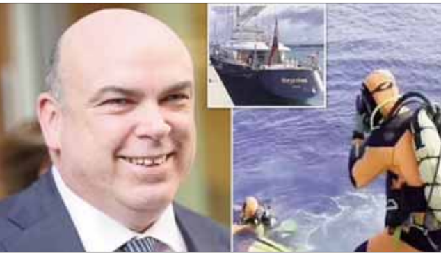
ਬਾਏਸੀਅਨ ਦੀ ਮਾਲਕ ਸੀ। ਮੋਰਗਨ ਸਟੈਨਲੇ ਇਟਰਨੈਸ਼ਨਲ ਦੇ ਪ੍ਰਧਾਨ ਜੋਨਾਥਨ ਬਲਮਰ ਅਤੇ ਉਨ੍ਹਾਂ ਦੀ ਪਤਨੀ ਵੀ ਕਿਸਤੀ 'ਤੇ ਸਵਾਰ ਸਨ। ਉਨ੍ਹਾਂ ਦੀ ਵੀ ਭਾਲ ਕੀਤੀ ਜਾਰੀ ਹੈ। ਬਲਮਰ ਲਿੰਚ ਦਾ ਕਰੀਬੀ ਦੋਸਤ ਹੈ। ਕਈ ਸਾਲਾਂ ਤੋਂ ਲਿੰਚ ਦਾ ਕੇਸ ਲੜ ਰਿਹਾ ਵਕੀਲ ਵੀ ਲਾਪਤਾ ਹੈ। ਇਟਾਲੀਅਨ ਕੋਸਟ ਗਾਰਡ ਦੇ ਇੱਕ ਅਧਿਕਾਰੀ ਨੇ ਦੱਸਿਆ ਕਿ ਸਵੇਰੇ 5 ਵਜੇ ਤੁਫਾਨ ਕਾਰਨ ਤੇਜ਼ ਲਹਿਰਾਂ ਆਈਆਂ, ਜੋਕਿ ਯਾਟ ਨਾਲ ਟਕਰਾਈਆਂ ਅਤੇ ਡੁੱਬ ਗਿਆ। ਇਹ ਯਾਟ ਸਿਸਲੀ ਦੀ ਰਾਜਧਾਨੀ ਪਲੇਰਮੋ ਤੋਂ ਲਗਭਗ 18 ਕਿਲੋਮੀਟਰ ਦੂਰ ਖੜ੍ਹੀ ਸੀ। ਹਾਲੇ ਤੱਕ ਇਹ ਸਪੱਸ਼ਟ ਨਹੀਂ ਹੋਇਆ ਹੈ ਕਿ ਕਿਸਤੀ ਕਿਨ੍ਹਾਂ ਹਾਲਾਤਾਂ ਵਿੱਚ ਡੁੱਬੀ। ਹਸਪਤਾਲ 'ਚ ਭਰਤੀ ਕਰੂ ਮੈਂਬਰਾਂ ਨਾਲ ਗੱਲ ਕਰਨ ਤੋਂ ਬਾਅਦ ਹੀ ਕੁਝ ਜਾਣਕਾਰੀ ਮਿਲ ਸਕੇਗੀ। ਹਾਲਾਂਕਿ, ਕੁਝ ਰਿਪੋਰਟਾਂ ਵਿੱਚ ਕਿਹਾ ਗਿਆ ਹੈ ਕਿ ਹਵਾਵਾਂ ਕਾਰਨ ਕਿਸਤੀ ਦਾ ਇੱਕ ਮਾਸਟ ਟੁੱਟ ਗਿਆ, ਜਿਸ ਕਾਰਨ ਕਿਸਤੀ ਸੰਤੁਲਨ ਗੁਆ ਬੈਠੀ ਅਤੇ ਪਲਟ ਗਈ।

ਰੋਮ, 20 ਅਗਸਤ (ਪੋਸਟ ਬਿਊਰੋ): ਇਟਲੀ ਦੇ ਸਿਸਲੀ ਟਾਪੂ ਨੇੜੇ ਸੋਮਵਾਰ ਸਵੇਰੇ ਬਾਏਸੀਅਨ ਨਾਮ ਦੀ ਲਗਜ਼ਰੀ ਯਾਟ ਡੁੱਬ ਗਈ। 184 ਫੁੱਟ ਲੰਬੀ ਇਸ ਯਾਟ 'ਤੇ 22 ਲੋਕ ਸਵਾਰ ਸਨ। ਇਨ੍ਹਾਂ ਵਿਚ ਅਮਰੀਕਾ, ਬ੍ਰਿਟੇਨ ਅਤੇ ਕੈਨੇਡਾ ਦੇ 10 ਕਰੂ ਮੈਂਬਰ ਅਤੇ 12 ਯਾਤਰੀ ਸ਼ਾਮਿਲ ਸਨ। ਕਿਸਤੀ ਦੇ ਮਲਬੇ ਦੀ ਪਛਾਣ ਕਰ ਲਈ ਗਈ ਹੈ। ਇਹ ਸਮੁੰਦਰ ਵਿੱਚ 50 ਮੀਟਰ ਦੀ ਡੂੰਘਾਈ ਵਿੱਚ ਪਾਇਆ ਗਿਆ ਸੀ। ਜਾਣਕਾਰੀ ਮੁਤਾਬਕ ਯਾਟ 'ਤੇ ਤਾਇਨਾਤ ਰਸੋਈਏ ਦੀ ਮੌਤ ਹੋ ਗਈ ਹੈ ਅਤੇ ਛੇ ਹੋਰ ਲਾਪਤਾ ਹਨ। ਲਾਪਤਾ ਲੋਕਾਂ 'ਚ ਬ੍ਰਿਟੇਨ ਦੇ ਮਸ਼ਹੂਰ ਸਾਫਟਵੇਅਰ ਕਾਰੋਬਾਰੀ ਮਾਈਕ ਲਿੰਚ ਅਤੇ ਉਨ੍ਹਾਂ ਦੀ 18 ਸਾਲਾ ਬੇਟੀ ਹੈਨਾ ਵੀ ਸ਼ਾਮਿਲ ਹੈ। ਕਾਰੋਬਾਰੀ ਲਿੰਚ ਦੀ ਪਤਨੀ ਐਂਜੇਲਾ ਬੋਕਾਰਸ ਨੂੰ ਬਚਾ ਲਿਆ ਗਿਆ ਹੈ। ਉਹ ਡੁੱਬੀ ਯਾਟ