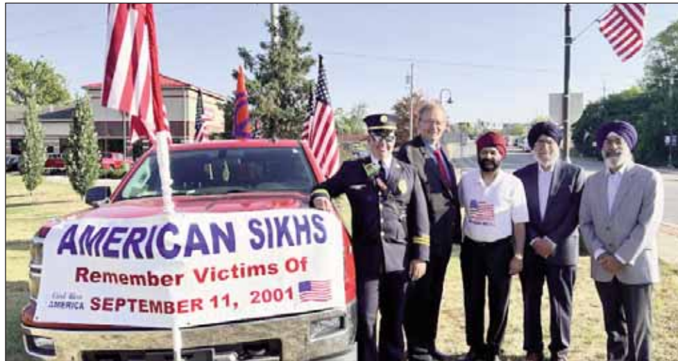
ਯਾਦਗਾਰੀ ਸਮਾਰੋਹ ਦਾ ਆਯੋਜਨ ਬੀਵਰਕ੍ਰੀਕ ਦੇ 9/11 ਮੈਮੋਰੀਅਲ ਵਿਖੇ ਕੀਤਾ ਜਾਂਦਾ ਹੈ ਜਿੱਥੇ ਸਟੀਲ ਦਾ ਇੱਕ 25-ਫੁੱਟ ਉੱਚਾ ਮੁੱਖਿਆ ਹੋਇਆ ਪਿਲਰ ਸਥਾਪਿਤ ਕੀਤਾ ਗਿਆ ਹੈ, ਜੋ ਹਮਲੇ ਤੋਂ ਪਹਿਲਾਂ ਵਰਲਡ ਟਰੇਡ ਸੈਂਟਰ ਦੇ ਉੱਤਰੀ ਟਾਵਰ ਦੀਆਂ

ਉਨ੍ਹਾਂ ਸਭਨਾਂ ਨੂੰ ਸਰਧਾਂਜਲੀ ਦੇਣ ਲਈ ਇਕੱਠੇ ਹੋਏ, ਜਿਨ੍ਹਾਂ ਨੇ ਇਹਨਾਂ ਹਮਲਿਆਂ ਵਿੱਚ ਆਪਣੀ ਜਾਣ ਗੁਆ ਦਿੱਤੀ। ਇਸ ਵਿੱਚ ਪੁਲਿਸ ਅਧਿਕਾਰੀ, ਅੱਗ ਬੁਝਾਊ, ਤੇ ਮੈਡੀਕਲ ਸੇਵਾਵਾਂ ਦੇ ਅਮਲੇ ਦੇ ਮੈਂਬਰ ਵੀ ਸ਼ਾਮਲ ਸਨ।"