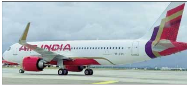
ਫਿਲਹਾਲ ਭਾਰਤ ਵਾਪਿਸ ਆ ਗਈ ਕੀਤੀ ਜਾ ਰਹੀ ਹੈ। ਹੈ, ਜਿਥੇ ਉਸ ਦੀ ਕਾਊਂਸਲਿੰਗ ਮਾਮਲਾ ਕੁਝ ਦਿਨ ਪਹਿਲਾਂ ਦਾ ਸ਼ਾਸਨਕ ਹੈ।

ਔਰਤ ਨੂੰ ਬੈਂਡ ਤੋਂ ਹੇਠਾਂ ਜ਼ਮੀਨ 'ਤੇ ਖਿੱਚ ਲਿਆ। ਪੀੜਤਾ ਦਰਵਾਜ਼ੇ ਵੱਲ ਜਾਣ ਦੀ ਕੋਸ਼ਿਸ਼ ਕਰ ਰਹੀ ਸੀ। ਇਸ ਦੌਰਾਨ ਜਦੋਂ ਉਸ ਨੇ ਰੋਲਾ ਪਾਇਆ ਤਾਂ ਨਾਲ ਵਾਲੇ ਕਮਰੇ 'ਚ ਬੈਠੇ ਕਰੂ ਮੈਂਬਰ ਉਥੇ ਪਹੁੰਚ ਗਏ। ਉਨ੍ਹਾਂ ਮੁਲਜ਼ਮ ਨੂੰ ਫੜ ਕੇ ਪੁਲਿਸ ਹਵਾਲੇ ਕਰ ਦਿੱਤਾ। ਇਸ ਤੋਂ ਬਾਅਦ ਔਰਤ ਨੂੰ ਹਸਪਤਾਲ ਲਿਜਾਇਆ ਗਿਆ। ਔਰਤ