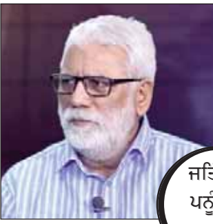
ਜ਼ਿੰਦਗੀ ਪ੍ਰਧਾਨ ਦੀ ਕਲਮ ਤੋਂ

ਅਸੀਂ ਇਸ ਹਫ਼ਤੇ ਭਾਰਤ ਦਾ ਇੱਕ ਹੋਰ ਆਜ਼ਾਦੀ ਦਿਵਸ ਮਨਾਇਆ ਜਾਂਦਾ ਵੇਖਿਆ ਹੈ। ਇਹ ਗੱਲ ਆਪਣੀ ਥਾਂ ਹੈ ਕਿ ਅਜੇ ਤੱਕ ਕਈ ਲੋਕ ਇਸ ਦੇਸ਼ ਨੂੰ ਆਜ਼ਾਦ ਹੋਇਆ ਨਹੀਂ ਮੰਨਦੇ ਅਤੇ ਪਿੰਡ ਵਿੱਚ ਕਈ ਬਜ਼ੁਰਗ ਮਿਲਦੇ ਹਨ, ਜਿਹੜੇ ਕਹਿੰਦੇ ਹਨ ਕਿ ਇਸ ਨਾਲੋਂ ਅੰਗਰੇਜ਼ਾਂ ਦਾ ਰਾਜ ਚੰਗਾ ਸੀ। ਇਹਦੀਆਂ ਦੀਆਂ ਗੱਲਾਂ ਉਨ੍ਹਾਂ ਸਿੱਧ ਲੋਕਾਂ ਦੀ ਆਪੋ-ਆਪਣੀ ਸੋਚ ਜਾਂ ਰਾਜਨੀਤਕ ਕਾਰਨਾਂ ਕਰ ਕੇ ਬਣੀ-ਬਣਾਈ ਧਾਰਨਾ ਦਾ ਪ੍ਰਗਟਾਵਾ ਹੋਣਗੀਆਂ, ਭਾਰਤ ਨੂੰ ਅੰਗਰੇਜ਼ਾਂ ਦੇ ਜਾਣ ਵੇਲੇ ਅਜ਼ਾਦੀ ਮਿਲ ਗਈ ਹੋਣਾ ਇਹ ਇਤਹਾਸਕ ਸੱਚਾਈ ਹੈ। ਕਹਿਣ ਵਾਲੇ ਭਾਰਤੀ ਪਾਰਲੀਮੈਂਟ ਦੀ ਇੱਕ ਮੈਂਬਰ ਕੁੜੀ ਇਹ ਵੀ ਕਹਿੰਦੀ ਹੈ ਕਿ ਅਸਲੀ ਆਜ਼ਾਦੀ ਉਸ ਦਿਨ ਨਸੀਬ ਹੋਈ ਸੀ, ਜਿਸ ਦਿਨ ਨਰਿੰਦਰ ਮੋਦੀ ਨੇ ਭਾਰਤ ਦੇ ਪ੍ਰਧਾਨ ਮੰਤਰੀ ਦਾ ਅਹੁਦਾ ਸੰਭਾਲਿਆ ਸੀ। ਕਿਹੜਾ ਕਿਸੇ ਨੂੰ ਰੋਕ ਦੇਣਾ ਹੈ। ਇਹਦੀਆਂ ਗੱਲਾਂ ਨਾਲ ਮਤਲਬ ਨਹੀਂ, ਜਿੰਦਗੀ ਦੀਆਂ ਲੋੜਾਂ ਦੀ ਪੂਰਤੀ ਨਾਲ ਮਤਲਬ ਹੈ। ਦੇਸ਼ ਦੇ ਗਰੀਬੀ ਮਾਰੇ ਲੋਕਾਂ ਦੀ ਇਹ ਆਸ ਲੱਖਾਂ ਸਮਾਂ ਰਾਜ ਕਰਦੀ ਰਹੀ ਕਾਂਗਰਸ ਪਾਰਟੀ ਵੀ ਪੂਰੀ ਨਹੀਂ ਸੀ ਕਰ ਸਕੀ ਅਤੇ ਉਸ ਦੀ ਥਾਂ ਲੈਣ ਵਾਲੀਆਂ ਧਿਰਾਂ ਵਿੱਚੋਂ ਅਜੋਕੀ ਮੁੱਖ ਧਿਰ ਭਾਜਪਾ ਵੀ ਆਸ ਪੂਰੀ ਨਹੀਂ ਕਰ ਸਕੀ। ਇਸ ਦੇ ਬਾਵਜੂਦ ਭਾਰਤ ਦੇ ਲੋਕ ਹਰ ਸਾਲ ਇਸ ਦਿਨ ਨੂੰ ਉਡੀਕਦੇ ਹਨ, ਪਰ ਇਹ ਦਿਨ ਕੋਈ ਕ੍ਰਿਸਮਾ ਵਿਖਾਉਣ