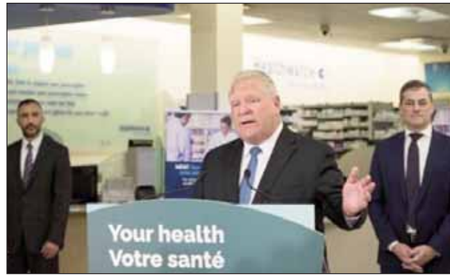
ਸ਼ਾਮਿਲ ਹਨ। ਹੁਣ ਸਰਕਾਰ ਗਲੋ ਵਿੱਚ ਖਾਰਜ, ਕਾਲਜ, ਹਲਕੇ ਸਿਰਦਰਦ, ਦਾਦ, ਮਾਮੂਲੀ ਨੀਂਦ ਸਬੰਧੀ ਵਿਕਾਰ, ਫੰਗਲ

ਲੰਬਿਤ ਹੱਲ ਦੇ ਰੂਪ ਵਿੱਚ ਵੇਖਦੇ ਹਨ, ਜਿਸ ਨਾਲ ਉਨ੍ਹਾਂ ਦੀ ਪੇਸ਼ੇਵਰ ਮੁਹਾਰਤ 'ਤੇ ਜ਼ਿਆਦਾ ਭਰੋਸਾ ਕੀਤਾ ਜਾ ਸਕੇ, ਉੱਥੇ ਹੀ ਡਾਕਟਰ ਚਿੰਤਾ ਜਤਾ ਰਹੇ ਹਨ। ਸਰਕਾਰ ਨੇ 2023 ਦੀ ਸ਼ੁਰੂਆਤ ਵਿੱਚ ਫਾਰਮਾਸਿਸਟਾਂ ਨੂੰ ਗੁਲਾਬੀ ਅੱਖ, ਬਵਾਸੀਰ ਅਤੇ ਮੁਤਰ ਮਾਰਗ ਦੇ ਇੰਫੈਕਸ਼ਨ ਸਮੇਤ 13 ਫੋਟੀ ਬੀਮਾਰੀਆਂ ਦਾ ਆਂਕਲਨ ਅਤੇ ਇਲਾਜ ਕਰਨ ਦੀ ਸਮਰੱਥਾ ਪ੍ਰਦਾਨ ਕੀਤੀ। ਉਸ ਸਾਲ ਦੀ ਸ਼ੁਰੂਆਤ ਵਿੱਚ ਸੂਚੀ ਵਿੱਚ ਛੇ ਹੋਰ ਜੋੜ ਦਿੱਤੇ ਗਏ, ਜਿਨ੍ਹਾਂ ਵਿੱਚ ਫਿਟੀਸ਼ੀ, ਕੈਂਸਰ ਦੇ ਜ਼ਖਮ ਅਤੇ ਚਮੜੀ ਦੀ ਇੰਫੈਕਸ਼ਨ