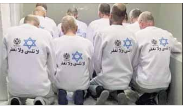
ਦਰਅਸਲ ਹਮਾਸ ਇਜ਼ਰਾਈਲੀ ਬੰਦੀਆਂ ਦੀ ਰਿਹਾਈ ਤੋਂ ਪਹਿਲਾਂ ਹਰ

ਤਲਅਵੀਵ, 16 ਫਰਵਰੀ (ਪੋਸਟ ਬਿਊਰੋ): ਹਮਾਸ ਦੀ ਕੈਦ ਤੋਂ ਇਜ਼ਰਾਈਲੀ ਬੰਦੀਆਂ ਦੀ ਰਿਹਾਈ ਤੋਂ ਬਾਅਦ ਇਜ਼ਰਾਈਲ ਨੇ ਸਨਿਚਰਵਾਰ ਨੂੰ 369 ਫਲਸਤੀਨੀ ਕੈਦੀਆਂ ਨੂੰ ਵੀ ਰਿਹਾਅ ਕਰ ਦਿੱਤਾ। ਟਾਈਮਜ਼ ਆਫ ਇਜ਼ਰਾਈਲ ਦੀ ਰਿਪੋਰਟ ਮੁਤਾਬਕ ਇਨ੍ਹਾਂ ਕੈਦੀਆਂ ਨੂੰ ਖਾਸ ਕਿਸਮ ਦੀ ਟੀ-ਸ਼ਰਟ ਪੁਆਕੇ ਰਿਹਾਅ ਕੀਤਾ ਗਿਆ ਹੈ। ਇਸ 'ਤੇ ਲਿਖਿਆ ਹੈ ਕਿ 'ਅਸੀਂ ਨਾ ਭੁੱਲਾਂਗੇ ਅਤੇ ਨਾ ਹੀ ਮੁਆਫ਼ ਕਰਾਂਗੇ'।