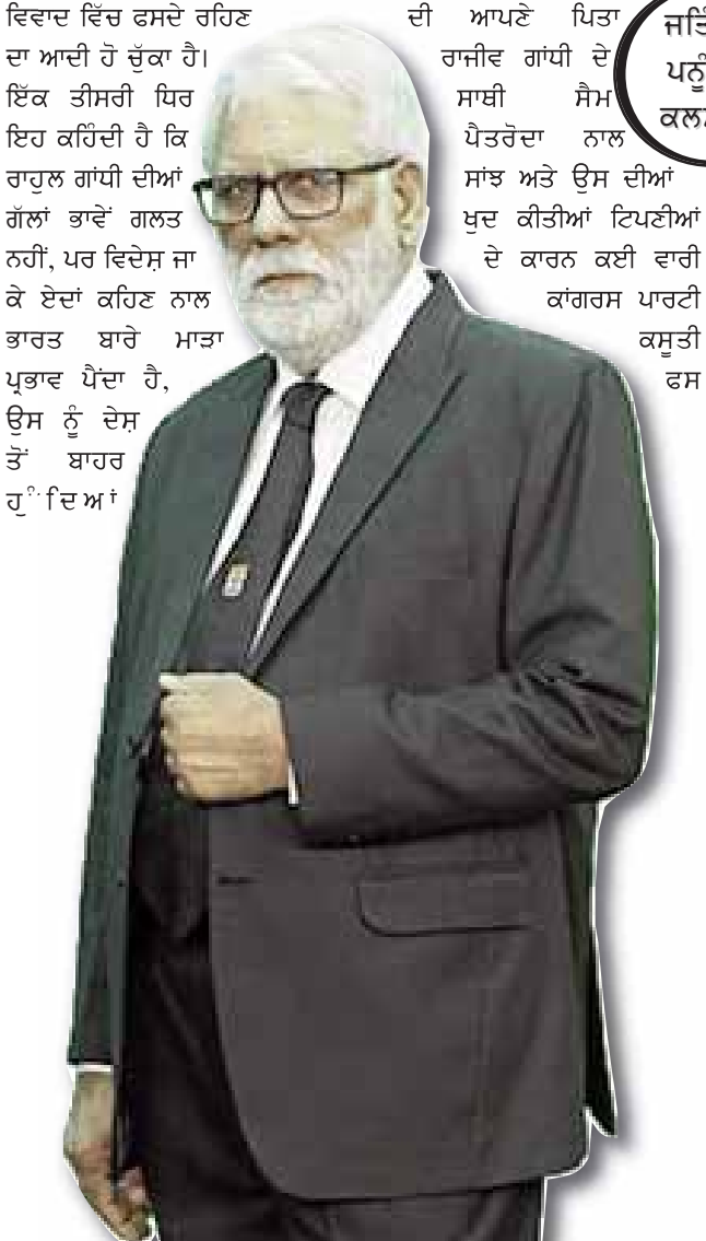
ਜ਼ਿੰਦਗੀ ਪੜ੍ਹ ਦੀ ਕਲਮ ਤੋਂ

ਵਿੱਚ ਰਹਿਣਾ ਏ ਕਿਸਾਨ ਵੀ ਸਨ ਅਤੇ ਉਨ੍ਹਾਂ ਵਿੱਚ ਹਰ ਧਰਮ ਨਾਲ ਜੁੜੇ ਕਿਸਾਨਾਂ ਦੇ ਉਸ ਇਕੱਠ ਦੀ ਇੱਕਸੁਰਤਾ ਉਨ੍ਹਾਂ ਦੇ ਨਾਅਰਿਆਂ ਤੱਕ ਸੀਮਤ ਨਹੀਂ ਸੀ, ਲੰਗਰ ਵੀ ਸਾਂਝਾ ਬਣਦਾ ਸੀ। ਕਾਂਗਰਸ ਦੇ ਲੀਡਰਾਂ ਦੀ ਸਿਆਸਤ ਵਿੱਚ ਕੁੱਚ ਅਤੇ ਲੋਕਾਂ ਨਾਲ ਕੀਤੇ ਧੱਕਿਆਂ ਦੀ ਕਹਾਣੀ ਆਪਣੀ ਥਾਂ ਹੈ ਅਤੇ ਉਸ ਨੂੰ ਅੱਖੋਂ ਓਹਲੇ ਕੋਈ ਨਹੀਂ ਕਰਨਾ ਚਾਹੇਗਾ, ਪਰ ਭਾਜਪਾ ਨੇ ਵੀ ਦੇਸ਼ ਦੇ ਆਮ ਲੋਕਾਂ ਨਾਲ ਘੱਟ ਨਹੀਂ ਕੀਤੀ। ਜਿੰਦਾਂ ਦੇ ਪੁੱਠੇ ਕੰਮ ਕਾਂਗਰਸੀ ਕਰਿਆ ਕਰਦੇ ਸਨ, ਹਰ ਵਿਗੜੇ ਹੋਏ ਅਤੇ ਬਦਨਾਮ ਕਾਂਗਰਸੀ ਆਗੂ ਨੂੰ ਆਪਣੇ ਵਿੱਚ ਰਲਾਉਣ ਲਈ ਤਿਆਰ ਰਹਿਣ ਵਾਲੀ ਭਾਜਪਾ ਦੇ ਆਗੂ ਵੀ ਉਹ ਸਾਰੇ ਪੁੱਠੇ ਕੰਮ ਕਰਦੇ ਹਨ ਅਤੇ ਸਗੋਂ ਇਨ੍ਹਾਂ ਪੁੱਠੇ ਕੰਮਾਂ ਨੂੰ ਆਪਣੀ ਫਿਰਕੂ ਸੋਚ ਦੀ ਪੁੱਠ ਚਾੜ੍ਹ ਕੇ ਹੋਰ ਵੱਡੇ ਗੁਨਾਹ ਕਰਦੇ ਪਏ ਹਨ। ਦੇਵਾਂ ਧਿਰਾਂ ਦੀ ਸੋਚ ਵਿੱਚ ਇੱਕ ਪਾਸੇ ਸਿੱਖੀ ਤਾਂ ਦੂਜੇ ਪਾਸੇ ਲੁਕਵੀਂ ਤੰਗਨਜਰੀ ਦਾ ਫਰਕ ਹੁੰਦਾ ਹੈ, ਪਰ ਜਦੋਂ ਇਨ੍ਹਾਂ ਦੇਵਾਂ ਦਾ ਤੋਲ-ਤੁਲਾਵਾ ਕਰਨ ਦੀ ਲੋੜ ਪਵੇ ਤਾਂ ਸਿੱਖਾਂ ਸਣੇ ਸਾਰੀਆਂ ਘੱਟ-ਗਿਣਤੀਆਂ ਬਾਰੇ ਭਾਜਪਾ ਦੇ ਗੁਨਾਹ ਕਾਂਗਰਸ ਤੋਂ ਘੱਟ ਨਹੀਂ ਨਿਕਲਣੇ। ਭਾਰਤ ਦੇ ਲੋਕਾਂ ਦੀ ਬਦਕਿਸਮਤੀ ਹੈ ਕਿ ਉਨ੍ਹਾਂ ਸਾਹ-ਮੌਂ ਇਸ ਵਕਤ ਵੀ ਕੋਈ ਤੀਸਰਾ ਬਦਲ ਨਹੀਂ ਅਤੇ ਉਹ ਇਨ੍ਹਾਂ ਦੇਵਾਂ ਨੂੰ ਭੁਗਤਦੇ ਪਏ ਹਨ।