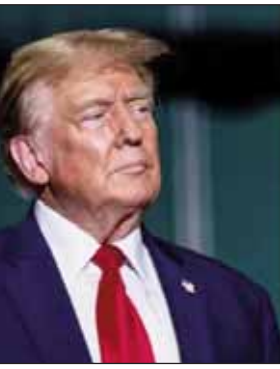
ਉਜ਼ਬੇਕਿਸਤਾਨ ਆਦਿ ਮੁਲਕਾਂ ਨਾਲ ਅਮਰੀਕੀ ਰਿਸ਼ਤਿਆਂ ਦੇ ਮਾਮਲਿਆਂ ਨੂੰ ਨਜ਼ਿਰ ਰੱਖਣਾ ਹੈ।