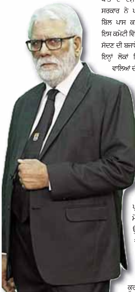
ਜਤਿੰਦਰ ਪਨੂੰ ਦੀ ਕਲਮ ਤੋਂ

ਕੁੱਲ ਮਿਲਾ ਕੇ ਭਾਰਤੀ ਪਾਰਲੀਮੈਂਟ ਦੇ ਹੇਠਲੇ ਹਾਉਸ, ਲੋਕ ਸਭਾ ਦੀ ਚੋਣ ਮੁਹਿੰਮ ਦੇ ਤਿੰਨ ਗੇੜ ਲੰਘਣ ਤੀਕਰ ਦੇਸ਼ ਦਾ ਮਾਹੌਲ ਪਹਿਲਾਂ ਵਾਲਾ ਨਹੀਂ ਜਾਪਦਾ। ਬਲਦੇ ਮਾਹੌਲ ਦੇ ਸੰਕੇਤ ਕੇਵਲ ਵਿੱਚ ਰਾਜ ਕਰਦੀ ਪਿਰ ਤੇ ਉਸ ਨਾਲ ਜੁੜੇ ਹੋਏ ਗੱਠਜੋੜ ਦੇ ਖਿਲਾਫ ਹਵਾ ਚੱਲਣ ਦੇ ਸੰਕੇਤ ਦੇਣ ਲੱਗ ਪਏ ਹਨ। ਏਵਾਂ ਦਾ ਮਾਹੌਲ ਪੈਦਾ ਕਰਨ ਲਈ ਵਿਰੋਧੀ ਪਿਰ ਨੇ ਓਨਾ ਕੰਮ ਨਹੀਂ ਕੀਤਾ, ਜਿੰਨਾ ਤਨਾਅ ਹੇਠ ਪ੍ਰਧਾਨ ਮੰਤਰੀ ਵੱਲੋਂ ਕੀਤੇ ਭਾਸ਼ਣ ਨਾਲ ਬਣਨ ਦੀ ਗੱਲ ਰਹੀ ਪਈ ਹੈ। ਫਿਰ ਵੀ ਇਹ ਕਹਿ ਦੇਣਾ ਅਜੇ ਤੱਕ ਵਕਤ ਤੋਂ ਪਹਿਲਾਂ ਦੀ ਗੱਲ ਹੈ ਕਿ ਭਾਜਪਾ ਤੇ ਇਸ ਨਾਲ ਜੁੜਿਆ ਗੱਠਜੋੜ ਐਤੱਤੀ ਸੱਤਾ ਤੱਕ ਪੁੱਜ ਨਹੀਂ ਸਕੇਗਾ। ਲੜਾਈ ਏਵਾਂ ਦੀ ਹੈ ਕਿ ਕੁਝ ਵੀ ਹੋ ਸਕਦਾ ਹੈ। ਜਿਸ ਤਰ੍ਹਾਂ ਦੀ ਸਖਤ ਲੜਾਈ ਇਸ ਵਾਰ ਬਣ ਗਈ ਹੈ, ਚੋਣ ਸਾਲਾਂ ਬਾਅਦ ਏਹੋ ਜਿਹਾ ਮਾਹੌਲ ਵੇਖਿਆ ਹੈ ਅਤੇ ਇਸ ਮਾਹੌਲ ਵਿੱਚ ਜੇ ਕੋਈ ਆਗੂ ਬਾਹਲਾ ਅਵਾਜ਼ਾਰ ਨਜ਼ਰ ਆਉਂਦਾ ਹੈ ਤਾਂ ਭਲਾ ਕੌਣ ਤੇ ਸਕਦਾ ਹੈ, ਕਹਿਣ ਦੀ ਲੋੜ ਨਹੀਂ।