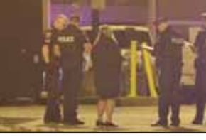
ਇੱਕ ਵਿਅਕਤੀ ਦੇ ਧਮਕੀ ਭਰੇ ਤਰੀਕੇ ਨਾਲ ਕੰਮ ਕਰਨ ਦੀ ਰਿਪੋਰਟ ਕੀਤੀ। ਐੱਸਆਈਯੂ ਨੇ ਕਿਹਾ ਕਿ ਅਧਿਕਾਰੀ ਬਿਲਡਿੰਗ ਦੀ 5ਵੀਂ ਮੰਜ਼ਿਲ 'ਤੇ ਗਏ, ਉਨ੍ਹਾਂ ਨੇ ਇੱਕ ਵਿਅਕਤੀ ਨਾਲ ਗੱਲਬਾਤ ਕੀਤੀ। 9 ਨਵੰਬਰ ਨੂੰ ਜਾਰੀ ਇੱਕ ਪ੍ਰੈੱਸ ਰਿਲੀਜ਼ ਵਿੱਚ ਕਿਹਾ ਗਿਆ ਕਿ ਗੋਲੀਬਾਰੀ ਹੋਈ,

ਹੈਮਿਲਟਨ ਵਿੱਚ ਗੋਲੀਬਾਰੀ 'ਚ ਇੱਕ ਪੁਲਿਸ ਅਧਿਕਾਰੀ ਅਤੇ ਇੱਕ ਵਿਅਕਤੀ ਜ਼ਖਮੀ, ਐੱਸਆਈਯੂ ਕਰ ਰਹੀ ਜਾਂਚ ਟੋਰਾਂਟੋ, 11 ਨਵੰਬਰ (ਪੋਸਟ ਬਿਊਰੋ): ਓਟਾਵੀ ਦੀ ਸਪੈਸ਼ਲ ਇੰਵੈਸਟੀਗੇਸ਼ਨ ਯੂਨਿਟ (SIU) ਹੈਮਿਲਟਨ ਵਿੱਚ ਗੋਲੀਬਾਰੀ ਦੌਰਾਨ ਇੱਕ ਪੁਲਿਸ ਅਧਿਕਾਰੀ ਅਤੇ 30 ਸਾਲਾ ਇੱਕ ਵਿਅਕਤੀ ਜ਼ਖਮੀ ਹੋ ਗਏ ਜਿਸ ਦੀ ਐੱਸਆਈਯੂ ਜਾਂਚ ਕਰ ਰਹੀ ਹੈ। ਸਿਵੀਲੀਅਨ ਏਜੰਸੀ ਅਨੁਸਾਰ, 1964 ਮੋਨ ਸਟਰੀਟ ਡਬਲਯੂ ਵਿੱਚ ਐੱਸਆਈਯੂ ਵੇਸਟ ਨੇਬਰਹੁੱਡ ਵਿੱਚ ਇੱਕ ਅਪਾਰਟਮੈਂਟ ਬਿਲਡਿੰਗ ਦੇ ਨਿਵਾਸੀ, ਜੋ ਓਸਲਰ ਸਟਰੀਟ ਦੇ ਦੱਖਣ ਵਿੱਚ ਹੈ, ਨੇ ਹੈਮਿਲਟਨ ਪੁਲਿਸ ਸਰਵਿਸ ਨਾਲ ਸੰਪਰਕ ਕਰਕੇ ਇੱਕ ਵਿਅਕਤੀ ਦੇ ਧਮਕੀ ਭਰੇ ਤਰੀਕੇ ਨਾਲ ਕੰਮ ਕਰਨ ਦੀ ਰਿਪੋਰਟ ਕੀਤੀ। ਐੱਸਆਈਯੂ ਨੇ ਕਿਹਾ ਕਿ ਅਧਿਕਾਰੀ ਬਿਲਡਿੰਗ ਦੀ 5ਵੀਂ ਮੰਜ਼ਿਲ 'ਤੇ ਗਏ, ਉਨ੍ਹਾਂ ਨੇ ਇੱਕ ਵਿਅਕਤੀ ਨਾਲ ਗੱਲਬਾਤ ਕੀਤੀ। 9 ਨਵੰਬਰ ਨੂੰ ਜਾਰੀ ਇੱਕ ਪ੍ਰੈੱਸ ਰਿਲੀਜ਼ ਵਿੱਚ ਕਿਹਾ ਗਿਆ ਕਿ ਗੋਲੀਬਾਰੀ ਹੋਈ, ਜਿਸਦੇ ਚਲਦੇ ਵਿਅਕਤੀ ਅਤੇ ਅਧਿਕਾਰੀ ਦੋਨਾਂ ਨੂੰ ਗੋਲੀ ਲੱਗ ਗਈ। ਏਜੰਸੀ ਨੇ ਕਿਹਾ ਕਿ ਅਧਿਕਾਰੀ ਅਤੇ ਵਿਅਕਤੀ ਦੋਨਾਂ ਨੂੰ ਇਲਾਜ ਲਈ ਹਸਪਤਾਲ ਲਿਜਾਇਆ ਗਿਆ। ਇਸ ਮਾਮਲੇ ਵਿੱਚ ਫੋ ਜਾਂਚਕਰਤਾਵਾਂ ਅਤੇ ਦੋ ਫੋਰੈਂਸਿਕ ਜਾਂਚਕਰਤਾਵਾਂ ਨੂੰ ਨਿਯੁਕਤ ਕੀਤਾ ਗਿਆ ਹੈ। ਐੱਸਆਈਯੂ ਨੇ ਕਿਹਾ ਹੈ ਕਿ ਜੇਕਰ ਕਿਸੇ ਵਿਅਕਤੀ ਇਸ ਘਟਨਾ ਬਾਰੇ ਜਾਣਕਾਰੀ ਤਾਂ ਉਹ 1-800-787-8529 'ਤੇ ਜਾਂ ਆਨਲਾਈਨ ਮੁੱਖ ਜਾਂਚਕਰਤਾ ਨਾਲ ਸੰਪਰਕ ਕਰ ਸਕਦਾ ਹੈ।