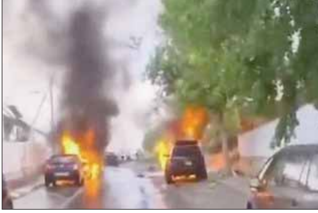
ਰਾਕੇਟ ਦਾਗੇ ਗਏ। ਆਈਡੀਐੱਫ ਨੇ ਹੈਫਾ 'ਤੇ ਹਮਲੇ ਦੇ ਕੁਝ ਘੰਟਿਆਂ ਬਾਅਦ ਹਿਜ਼ਬੁੱਲਾ ਰਾਕੇਟ ਲਾਂਚਰਾਂ ਨੂੰ ਨਸ਼ਟ ਕਰ ਦਿੱਤਾ। ਇਜ਼ਰਾਈਲ ਨੇ 54 ਦਿਨਾਂ ਬਾਅਦ 17 ਸਤੰਬਰ ਨੂੰ ਲੇਬਨਾਨ ਵਿੱਚ ਹਿਜ਼ਬੁੱਲਾ ਦੇ ਮੈਂਬਰਾਂ ਦੇ ਪੰਜ ਵੱਖ-ਵੱਖ ਹੋਟੇ ਲੜੀਵਾਰ ਧਮਾਕਿਆਂ ਦੀ ਜ਼ਿੰਮੇਵਾਰੀ ਲਈ ਹੈ। ਪ੍ਰਧਾਨ ਮੰਤਰੀ ਨੇਤਨਯਾਹੂ ਨੇ ਐਤਵਾਰ ਨੂੰ ਮੰਨਿਆ ਕਿ ਉਨ੍ਹਾਂ ਨੇ ਇਜ਼ਰਾਈਲ ਦੀ ਸੁਰੱਖਿਆ ਨੂੰ ਲੈ ਕੇ ਹਮਲੇ ਨੂੰ ਮਨਜ਼ੂਰੀ ਦਿੱਤੀ ਸੀ।

ਤਲਅਵੀਵ, 11 ਨਵੰਬਰ (ਪੋਸਟ ਬਿਊਰੋ): ਹਿਜ਼ਬੁੱਲਾ ਨੇ ਸੋਮਵਾਰ ਨੂੰ ਇਜ਼ਰਾਈਲ 'ਤੇ 165 ਤੋਂ ਜ਼ਿਆਦਾ ਰਾਕੇਟਾਂ ਨਾਲ ਹਮਲਾ ਕੀਤਾ। ਇਜ਼ਰਾਈਲ ਦੇ ਉੱਤਰੀ ਸ਼ਹਿਰ ਬੀਨਾ ਵਿੱਚ ਹੋਏ ਇਸ ਹਮਲੇ ਵਿੱਚ ਇੱਕ ਬੱਚੇ ਸਮੇਤ ਸੱਤ ਲੋਕ ਜ਼ਖਮੀ ਹੋ ਗਏ ਹਨ। ਇਸ ਤੋਂ ਇਲਾਵਾ ਇਸ ਹਮਲੇ ਵਿੱਚ ਗਲੀਲੀ ਸ਼ਹਿਰ ਨੂੰ ਵੀ ਨਿਸ਼ਾਨਾ ਬਣਾਇਆ ਗਿਆ ਸੀ। ਇੱਥੇ 55 ਰਾਕੇਟ ਦਾਗੇ ਗਏ। ਜਦੋਂ ਕਿ ਹਿਜ਼ਬੁੱਲਾ ਨੇ ਹੈਫਾ ਸ਼ਹਿਰ 'ਤੇ 90 ਰਾਕੇਟ ਦਾਗੇ। ਇਜ਼ਰਾਈਲੀ ਰੱਖਿਆ ਬਲ (ਆਈਡੀਐੱਫ) ਅਨੁਸਾਰ, ਹਿਜ਼ਬੁੱਲਾ ਨੇ ਪਹਿਲੀ ਵਾਰ ਹੈਫਾ 'ਤੇ 80 ਰਾਕੇਟ ਦਾਗੇ। ਉਨ੍ਹਾਂ ਵਿੱਚੋਂ ਜ਼ਿਆਦਾਤਰ ਨੂੰ ਹਵਾ ਵਿੱਚ ਗੋਲੀ ਮਾਰ ਦਿੱਤੀ ਗਈ ਸੀ। ਦੂਜੀ ਵਾਰ 10