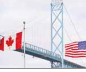
ਤੋਂ ਖੋਲ੍ਹ ਦਿੱਤਾ ਗਿਆ ਹੈ। ਇਸ ਦੌਰਾਨ ਕੋਈ ਹੋਰ ਬਿਓਰਾ ਨਹੀਂ ਦਿੱਤਾ ਗਿਆ। PSAC ਅਤੇ Customs and Immigration Union 9 ਨਵੰਬਰ ਨੂੰ ਵਿੰਡਸਰ ਵਿੱਚ ਹੋਈ ਦੁਖਦ ਘਟਨਾ ਤੋਂ ਜਾਣੂ ਹਨ, ਜਿਥੇ ਇੱਕ ਸੀਮਾ ਅਧਿਕਾਰੀ ਨੇ ਕੰਮ 'ਤੇ ਆਪਣੀ ਜਾਨ ਲੈ ਲਈ। ਅਸੀਂ ਮ੍ਰਿਤਕ ਦੇ ਪਰਿਵਾਰ, ਦੋਸਤਾਂ ਅਤੇ ਸਹਿਕਰਮੀਆਂ ਪ੍ਰਤੀ ਆਪਣਾ ਦੁੱਖ ਪ੍ਰਗਟ ਕਰਦੇ ਹਾਂ।

ਏਬੋਸਡਰ ਬ੍ਰਿਜ 'ਤੇ ਇੱਕ ਕਰਮਚਾਰੀ ਨੇ ਲਈ ਆਪਣੀ ਜਾਨ ਵਿੰਡਸਰ, 11 ਨਵੰਬਰ (ਪੋਸਟ ਬਿਊਰੋ): ਵਿੰਡਸਰ, ਓਟਾਵੀ ਅਤੇ ਡੋਟਰਾਇਟ, ਐੱਸਆਈਯੂ ਨੂੰ ਜੋੜਨ ਵਾਲੇ ਏਬੋਸਡਰ ਬ੍ਰਿਜ 'ਤੇ ਕੈਨੇਡਾ ਬਾਰਡਰ ਸਰਵਿਸਜ਼ ਏਜੰਸੀ ਦੇ ਕਰਮਚਾਰੀਆਂ ਦੀ ਤਰਜਮਾਨੀ ਕਰਨ ਵਾਲੀ ਯੂਨੀਅਨ, ਪਬਲਿਕ ਸਰਵਿਸ ਅਲਾਇੰਸ ਆਫ ਕੈਨੇਡਾ (PSAC) ਵੱਲੋਂ ਪੁਸ਼ਟੀ ਕੀਤੀ ਗਈ ਹੈ ਕਿ ਸ਼ਨੀਵਾਰ ਨੂੰ ਏਬੋਸਡਰ ਬ੍ਰਿਜ 'ਤੇ ਇੱਕ ਕਰਮਚਾਰੀ ਨੇ ਆਪਣੀ ਜਾਨ ਲੈ ਲਈ ਹੈ। ਵਿੰਡਸਰ ਪੁਲਿਸ ਨੇ ਸਵੇਰੇ 10 ਵਜੇ ਦੇ ਆਸਪਾਸ ਸੋਸਲ ਮੀਡੀਆ 'ਤੇ ਪੋਸਟ ਕੀਤਾ ਕਿ ਪੁਲ ਕੋਲ ਆਵਾਜਾਈ ਨੂੰ ਮੁੜ ਤੋਂ ਰੁੱਟ ਕੀਤਾ ਜਾ ਰਿਹਾ ਹੈ। ਦੁਪਹਿਰ 3 ਵਜੇ ਤੋਂ ਬਾਅਦ, ਪੁਲਿਸ ਨੇ ਫਿਰ ਤੋਂ ਪੋਸਟ ਕੀਤਾ ਕਿ ਪੁਲ ਨੂੰ ਫਿਰ ਤੋਂ ਖੋਲ੍ਹ ਦਿੱਤਾ ਗਿਆ ਹੈ। ਇਸ ਦੌਰਾਨ ਕੋਈ ਹੋਰ ਬਿਓਰਾ ਨਹੀਂ ਦਿੱਤਾ ਗਿਆ। PSAC ਅਤੇ Customs and Immigration Union 9 ਨਵੰਬਰ ਨੂੰ ਵਿੰਡਸਰ ਵਿੱਚ ਹੋਈ ਦੁਖਦ ਘਟਨਾ ਤੋਂ ਜਾਣੂ ਹਨ, ਜਿਥੇ ਇੱਕ ਸੀਮਾ ਅਧਿਕਾਰੀ ਨੇ ਕੰਮ 'ਤੇ ਆਪਣੀ ਜਾਨ ਲੈ ਲਈ। ਅਸੀਂ ਮ੍ਰਿਤਕ ਦੇ ਪਰਿਵਾਰ, ਦੋਸਤਾਂ ਅਤੇ ਸਹਿਕਰਮੀਆਂ ਪ੍ਰਤੀ ਆਪਣਾ ਦੁੱਖ ਪ੍ਰਗਟ ਕਰਦੇ ਹਾਂ।