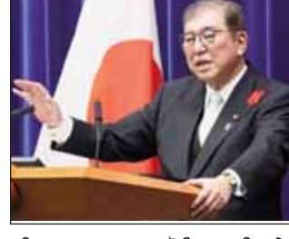
ਸੀਟਾਂ ਦਾ ਨੁਕਸਾਨ ਹੋਇਆ। ਪਿਛਲੇ 15 ਸਾਲਾਂ ਵਿੱਚ ਪਾਰਟੀ ਦਾ ਇਹ ਸਭ ਤੋਂ ਮਾੜਾ ਪ੍ਰਦਰਸ਼ਨ ਸੀ। ਸੋਮਵਾਰ 11 ਨਵੰਬਰ ਨੂੰ ਸੰਸਦ ਦਾ ਵਿਸ਼ੇਸ਼ ਸੈਸ਼ਨ ਬੁਲਾਇਆ ਗਿਆ ਸੀ। ਪਿਛਲੇ 30 ਸਾਲਾਂ ਵਿੱਚ ਪਹਿਲੀ ਵਾਰ ਜਾਪਾਨ ਵਿੱਚ

ਸ਼ਿਗੋਰੂ ਇਸ਼ੀਬਾ ਦੁਬਾਰਾ ਚੁਣੇ ਗਏ ਜਾਪਾਨ ਦੇ ਪ੍ਰਧਾਨ ਮੰਤਰੀ, ਵਿਰੋਧੀ ਧਿਰ ਦੇ ਨੇਤਾ ਯੋਸ਼ੀਹਿਕੋ ਨੋਡਾ ਨੂੰ 221-160 ਦੇ ਫਰਕ ਨਾਲ ਹਰਾਇਆ ਟੋਕੀਓ, 11 ਨਵੰਬਰ (ਪੋਸਟ ਬਿਊਰੋ): ਜਾਪਾਨ ਦੇ ਪ੍ਰਧਾਨ ਮੰਤਰੀ ਸ਼ਿਗੋਰੂ ਇਸ਼ੀਬਾ ਦੁਬਾਰਾ ਫਿਰ ਦੋਸ਼ ਦੇ ਪ੍ਰਧਾਨ ਮੰਤਰੀ ਬਣ ਗਏ ਹਨ। ਸੋਮਵਾਰ ਨੂੰ ਜਾਪਾਨ ਦੀ ਸੰਸਦ ਨੇ ਉਨ੍ਹਾਂ ਨੂੰ ਅਗਲਾ ਪ੍ਰਧਾਨ ਮੰਤਰੀ ਚੁਣਿਆ। ਜਾਪਾਨ ਵਿੱਚ 27 ਅਕਤੂਬਰ ਨੂੰ ਸੰਸਦੀ ਚੋਣਾਂ ਹੋਈਆਂ ਸਨ। ਇਸ਼ੀਬਾ ਦੀ ਲਿਬਰਲ ਡੈਮੋਕ੍ਰੇਟਿਕ ਪਾਰਟੀ (ਐੱਲਡੀਪੀ) ਨੇ ਇਨ੍ਹਾਂ ਚੋਣਾਂ ਵਿੱਚ ਆਪਣਾ ਬਹੁਮਤ ਗੁਆ ਦਿੱਤਾ ਹੈ। ਸੰਸਦੀ ਚੋਣਾਂ ਵਿੱਚ ਐੱਲਡੀਪੀ ਨੂੰ ਸਿਰਫ਼ 191 ਸੀਟਾਂ ਮਿਲੀਆਂ ਅਤੇ 65 ਪ੍ਰਧਾਨ ਮੰਤਰੀ ਦੀ ਚੋਣ ਲਈ ਵੋਟਿੰਗ ਹਰਾਇਆ। ਹਾਲਾਂਕਿ, 465 ਸੀਟਾਂ ਵਾਲੀ ਸੰਸਦ ਵਿੱਚ ਬਹੁਮਤ ਲਈ 233 ਦਾ ਅੰਕੜਾ ਜ਼ਰੂਰੀ ਹੈ। ਯੋਸ਼ੀਹਿਕੋ ਨੋਡਾ ਨੂੰ 221-160 ਨਾਲ ਹਰਾਇਆ। ਇਸ ਤੋਂ ਬਾਅਦ ਦੋ ਸਮਰਥਨ ਨਾਲ ਮੁੱਖ ਵਿਰੋਧੀ ਨੇਤਾ ਦਾ ਅੰਕੜਾ ਜ਼ਰੂਰੀ ਹੈ।