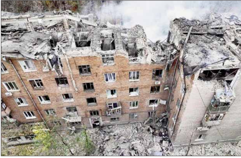
ਇਸ ਤੋਂ ਇਲਾਵਾ ਰੂਸ ਨੇ ਸੁਕਤੀਸਾਲੀ ਗਲਾਈਡ ਬੰਬ ਦਾਗੇ। ਜੁਪੋਰੀਜ਼ੀਆ ਸ਼ਹਿਰ 'ਤੇ 3 ਇਸ ਵਿੱਚ ਇੱਕ ਵਿਅਕਤੀ ਦੀ ਮੌਤ ਹੋ ਗਈ।

ਮਾਸਕੋ, 11 ਨਵੰਬਰ (ਪੋਸਟ ਬਿਊਰੋ): ਰੂਸ ਨੇ ਸੋਮਵਾਰ ਨੂੰ ਯੂਕਰੇਨ 'ਤੇ ਡਰੋਨ ਅਤੇ ਬੈਲਿਸਟਿਕ ਮਿਜ਼ਾਈਲਾਂ ਨਾਲ ਹਮਲਾ ਕੀਤਾ। ਇਸ ਦੌਰਾਨ ਰੂਸ ਨੇ ਯੂਕਰੇਨ ਦੇ ਦੱਖਣ-ਪੱਛਮੀ ਸ਼ਹਿਰਾਂ 'ਤੇ ਗਲਾਈਡ ਬੰਬ ਵੀ ਸੁਟੇ। ਇਨ੍ਹਾਂ ਹਮਲਿਆਂ ਵਿੱਚ ਛੇ ਯੂਕਰੇਨੀ ਨਾਗਰਿਕਾਂ ਦੀ ਮੌਤ ਹੋ ਗਈ ਹੈ, ਜਦੋਂ ਕਿ 30 ਤੋਂ ਵੱਧ ਜ਼ਖਮੀ ਹਨ। ਰੂਸ ਵੱਲੋਂ ਨਿਸ਼ਾਨਾ ਬਣਾਏ ਗਏ ਯੂਕਰੇਨ ਦੇ ਸ਼ਹਿਰ ਯੂਥ ਪੇਤਰ ਦੀ ਫਰੰਟ ਲਾਈਨ ਤੋਂ 1000 ਕਿਲੋਮੀਟਰ ਦੇ ਘੇਰੇ ਵਿੱਚ ਹਨ। ਸੋਮਵਾਰ ਨੂੰ ਰੂਸੀ ਹਮਲੇ ਵਿੱਚ ਮਾਰੇ ਗਏ ਪੰਜ ਨਾਗਰਿਕਾਂ ਵਿੱਚੋਂ ਜ਼ਿਆਦਾਤਰ ਦੱਖਣੀ ਸ਼ਹਿਰ ਮਾਈਕੋਲਾਈਵ ਵਿੱਚ ਸਨ। ਇਸ ਸ਼ਹਿਰ 'ਤੇ ਰੂਸ ਨੇ ਡਰੋਨ ਨਾਲ ਹਮਲਾ ਕੀਤਾ ਸੀ। ਹਮਲੇ 'ਚ 45 ਸਾਲਾ ਔਰਤ ਵੀ ਜ਼ਖਮੀ ਹੋ ਗਈ।