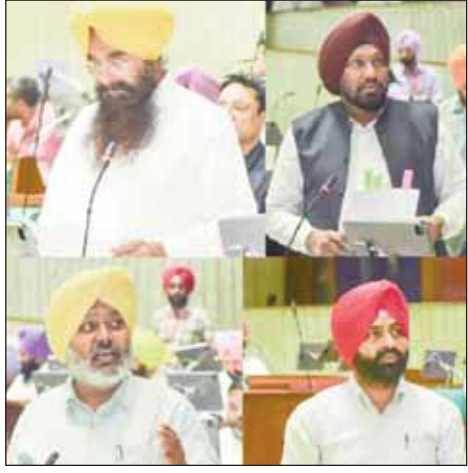
ਪੰਜਾਬ ਖੇਤੀਬਾੜੀ ਉਤਪਾਦ ਮੰਡੀਆਂ (ਸੋਧਨਾ) ਬਿੱਲ, 2024 ਪੇਸ਼ ਕੀਤਾ ਜੋ ਵਿਧਾਨ ਸਭਾ ਵਿੱਚ ਬਹੁਮਤ ਨਾਲ ਪਾਸ ਹੋ ਗਿਆ।

ਚੰਡੀਗੜ੍ਹ, 4 ਸਤੰਬਰ (ਪੋਸਟ ਬਿਊਰੋ): ਪੰਜਾਬ ਵਿਧਾਨ ਸਭਾ ਨੇ ਅੱਜ 4 ਮਹੱਤਵਪੂਰਨ ਬਿੱਲ ਜਿਨ੍ਹਾਂ ਵਿੱਚ ਪੰਜਾਬ ਗੁੱਡਜ਼ ਐਂਡ ਸਰਵਿਸਜ਼ ਟੈਕਸ (ਸੋਧਨਾ) ਬਿੱਲ, 2024, ਪੰਜਾਬ ਫਾਇਰ ਐਂਡ ਐਮਰਜੈਂਸੀ ਸਰਵਿਸ ਬਿੱਲ, 2024, ਪੰਜਾਬ ਪੰਚਾਇਤੀ ਰਾਜ (ਸੋਧਨਾ) ਬਿੱਲ, 2024 ਤੋਂ ਪੰਜਾਬ ਖੇਤੀਬਾੜੀ ਉਤਪਾਦ ਮੰਡੀਆਂ (ਸੋਧਨਾ) ਬਿੱਲ, 2024 ਸ਼ਾਮਲ ਹਨ, ਵਿਧਾਨ ਸਭਾ ਸੈਸ਼ਨ ਵਿੱਚ ਪਾਸ ਕੀਤੇ।