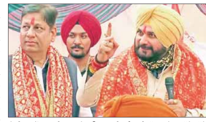
ਕੋਈ ਸਮਝੌਤਾ ਨਹੀਂ ਕਰਨਗੇ। ਉਨ੍ਹਾਂ ਕਿਹਾ ਕਿ ਸਿਆਸਤ ਕਾਰੋਬਾਰ ਹੋ ਗਿਆ ਹੈ, ਮਿਸ਼ਨ ਨਹੀਂ ਰਿਹਾ, ਉਹ ਲੋਕ ਖਤਮ ਹੋ ਗਏ ਹਨ, ਜਿਨ੍ਹਾਂ ਦੇ ਆਦਰਸ਼ਾਂ ਉੱਤੇ ਲੋਕ ਜਾਨ ਦੇਣ ਨੂੰ ਤਿਆਰ ਰਹਿੰਦੇ ਸਨ। ਉਨ੍ਹਾਂ ਕਿਹਾ ਕਿ ਅੱਜ ਪੰਜਾਬ ਦੇ ਸਿੱਖ ਲੋਕ ਕਰੋੜ ਰੁਪਏ ਕਰਜ਼ੇ, ਲੋਕ ਇਹ ਵਹਿਮ ਕੱਢ ਦੇਣ ਇਹ ਸਰਕਾਰ ਨੇ ਭਰਨਾ ਹੈ, ਇਹ ਲੋਕਾਂ ਨੇ ਭਰਨਾ ਹੈ। ਸਿਆਸੀ ਪਾਰਟੀਆਂ ਵਾਲੇ ਤਿੰਨ-ਤਿੰਨ, ਚਾਰ-ਚਾਰ ਪੈਨਸ਼ਨਾਂ ਲੈਂਦੇ ਹਨ, ਪਰ ਮੈਂ ਦੁਬਾਰਾ ਜਿੱਤਿਆ ਤਾਂ ਦੂਜੀ ਪੈਨਸ਼ਨ ਨਹੀਂ ਲਵਾਂਗਾ। ਮੈਂ ਵਾਅਦੇ ਪੂਰੇ ਕਰਨ

ਦਾ ਨਾਂ ਲਏ ਬਿਨਾ ਕਿਹਾ, ਗੁਰੂ ਦਾ ਅਪਮਾਨ ਕਰਨ ਵਾਲਾ ਸੁਖ ਨਾਲ ਕਿਵੇਂ ਰਹਿ ਸਕਦਾ ਹੈ, ਪਹਿਲਾਂ ਸਰਕਾਰ ਬਦਲੀ, ਫਿਰ ਮੁੱਖ ਮੰਤਰੀ ਨੂੰ ਰਾਜੇ ਤੋਂ ਰੱਕ ਬਣਾ ਦਿੱਤਾ ਤੇ ਫਿਰ ਇੱਕ ਹੋਰ ਬਣਾ ਦਿੱਤਾ। ਉਹ ਦੇਖਦਾ ਹੈ ਕਿ ਕੌਣ ਸੋਨਾ ਹੈ ਤਾਂ ਕੌਣ ਸਿੱਟੀ। ਅਸਲੀ ਲੋਕ ਪੰਜਾਬ ਦੀ ਮਿੱਟੀ ਵਿੱਚ ਮਣੀਆਂ ਵਾਂਗ ਰੁਲਦੇ ਹਨ, ਤੁਸੀਂ ਉਨ੍ਹਾਂ ਨੂੰ ਚੁੱਕੋ ਅਤੇ ਮੁਕੁਟ ਵਿੱਚ ਸਜਾਓ। ਮੁੱਖ ਮੰਤਰੀ ਚਰਨਜੀਤ ਸਿੰਘ ਚੰਨੀ ਨੇ ਬੀਤੇ ਦਿਨੀਂ ਕਿਹਾ ਸੀ ਕਿ ਪੰਜਾਬ ਦਾ ਖਜ਼ਾਨਾ ਭਰਿਆ ਹੈ। ਸਿੱਧੂ ਨੇ ਚੰਨੀ ਦਾ ਨਾਂ ਲਏ ਬਿਨਾਂ ਕਿਹਾ 'ਗਲਤ ਹਨ ਉਹ ਲੋਕ, ਜਿਹੜੇ ਕਹਿੰਦੇ ਹਨ ਕਿ ਖਜ਼ਾਨਾ ਭਰਿਆ ਹੈ। ਜੇ ਭਰਿਆ ਹੈ ਤਾਂ ਕੱਚੇ ਮੁਲਾਜ਼ਮ ਪੱਕੇ ਕਿਉਂ ਨਹੀਂ ਕਰਦੇ। ਲੋਕ ਪੱਕੇ ਹੋਣ ਦੀ ਮੰਗ ਲਈ ਟੈਂਕੀਆਂ ਉੱਤੇ ਚੜ੍ਹੇ ਹਨ। ਖਜ਼ਾਨਾ ਭਰਿਆ ਹੈ ਤਾਂ ਮੁਲਾਜ਼ਮਾਂ ਦੀ ਪੁਰਾਣੀ ਪੈਨਸ਼ਨ ਬਹਾਲ ਕਰੋ। ਉਨ੍ਹਾਂ ਕਿਹਾ ਕਿ ਉਨ੍ਹਾਂ ਦਾ ਮਕਸਦ ਪੰਜਾਬ ਵਿੱਚ ਸਰਕਾਰ ਬਣਾਉਣਾ ਨਹੀਂ, ਪੰਜਾਬ ਦੇ ਲੋਕਾਂ ਦੀ ਭਲਾਈ ਕਰਨਾ ਹੈ ਅਤੇ ਉਹ ਇਸ ਲਈ