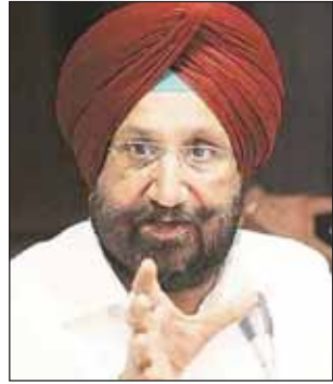
ਬੇਅਦਬੀ ਅਤੇ ਨਸ਼ੇ ਦੇ ਮਾਮਲੇ ਵਿੱਚ

ਧਾਰਮਿਕ ਗ੍ਰੰਥ ਦੀ ਬੇਅਦਬੀ ਕਰਨ ਵਾਲਿਆਂ ਦੇ ਖਿਲਾਫ ਕਾਂਗਰਸ ਸਰਕਾਰ ਸਖਤ ਕਾਨੂੰਨ ਲਿਆ ਰਹੀ ਹੈ, ਜਿਸ ਹੇਠ ਬੇਅਦਬੀ ਕਰਨ ਵਾਲਿਆਂ ਨੂੰ 10 ਸਾਲ ਸਖਤ ਸਜ਼ਾ ਭੁਗਤਣੀ ਪਵੇਗੀ। ਇਸ ਕਾਨੂੰਨ ਦਾਮਤਾ ਪਾਸ ਹੋਣ ਲਈ ਕੇਂਦਰ ਸਰਕਾਰ ਕੋਲ ਭੇਜਿਆ ਗਿਆ ਹੈ ਅਤੇ ਜਲਦੀ ਹੀ ਇਹ ਕਾਨੂੰਨ ਲਾਗੂ ਹੋਣ ਜਾ ਰਿਹਾ ਹੈ। ਸ੍ਰੀ ਗੁਰੂ ਗ੍ਰੰਥ ਸਾਹਿਬ ਅਤੇ ਸ੍ਰੀ ਗੁਰੂ ਗ੍ਰੰਥ ਸਾਹਿਬ ਦੀ