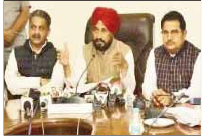
ਚਰਨਜੀਤ ਸਿੰਘ ਚੰਨੀ ਨੇ ਕੋਆਪ੍ਰੇਟਿਵ ਬੈਂਕਾਂ ਰਾਹੀਂ ਲੈਣ-ਦੇਣ ਕੋਆਪ੍ਰੇਟਿਵ ਬੈਂਕਾਂ ਰਾਹੀਂ ਕੀਤਾ ਜਾਵੇਗਾ। ਇਸ ਫੈਸਲੇ ਨੂੰ ਪੰਜਾਬ ਕੈਬਨਿਟ ਪ੍ਰਵਾਨਗੀ ਦੇਵੇਗੀ ਅਤੇ ਸਰਕਾਰੀ ਅਤੇ ਅਰਧ ਸਰਕਾਰੀ ਅਦਾਰਿਆਂ ਦਾ ਲੈਣ-ਦੇਣ ਕੋਆਪ੍ਰੇਟਿਵ ਬੈਂਕਾਂ ਰਾਹੀਂ ਯਕੀਨੀ ਕੀਤਾ ਜਾਵੇਗਾ। ਉਨ੍ਹਾਂ ਨੇ ਇਹ ਫੈਸਲਾ 15 ਦਿਨਾਂ ਵਿੱਚ ਲਾਗੂ ਕਰਨ ਦਾ ਭਰੋਸਾ ਦਿੱਤਾ।

ਪੰਜਾਬ ਵਿੱਚ ਸਮਤੀ ਕਰਨ ਨੂੰ ਖੁਸ਼ੀ ਮੰਨਦਿਆਂ ਕਿਹਾ ਕਿ ਅੱਜ ਤੋਂ ਪੰਜਾਬ ਵਿੱਚ ਮਾਈਨਿੰਗ ਮਾਰੀਆ ਖਤਮ ਕਰਕੇ ਮਾਈਨਿੰਗ ਦੀ ਹਰ ਬਾਪੁਲਸ ਦਾ ਪਹਿਰਾ ਲਾ ਦਿੱਤਾ ਹੈ ਤਾਂ ਕਿ ਰੇਤੇ ਦੀ ਕਾਲਾਬਾਜ਼ਾਰੀ ਰੋਕੀ ਜਾ ਸਕੇ। ਉਨ੍ਹਾਂ ਕਿਹਾ ਕਿ ਪੁਲਸ ਨੂੰ ਜ਼ਿੰਮੇਵਾਰੀ ਦਿੱਤੀ ਹੈ ਕਿ ਉਹ ਯਕੀਨੀ ਕਰੇ ਕਿ ਹਰ ਕਿਸੇ ਨੂੰ ਰੇਤਾ 9 ਰੁਪਏ ਫੁੱਟ ਦੇ ਸਰਕਾਰੀ ਰੇਟ ਨਾਲ ਮਿਲੇ ਅਤੇ ਜੇ ਡਿਊਟੀ ਉੱਤੇ ਤਾਇਨਾਤ ਪੁਲਿਸ ਵਾਲੇ ਖੁਸ਼ਾਹ ਚੌਕੀਆਂ ਦੇ ਪਤਾ ਲੱਗੇ ਤਾਂ ਉਨ੍ਹਾਂ ਉੱਤੇ ਮਿਸਾਲੀ ਕਾਰਵਾਈ ਕੀਤੀ ਜਾਵੇਗੀ।