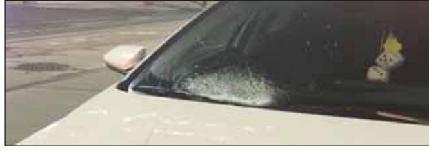
ਇਹ ਘਟਨਾ ਰਾਤੀਂ 9:10 ਉੱਤੇ ਯੌਰਕ ਸਟਰੀਟ ਤੇ ਐਂਡੀਲੋਡ ਸਟਰੀਟ

ਟੋਰਾਂਟੋ, 1 ਨਵੰਬਰ (ਪੋਸਟ ਬਿਊਰੋ) :ਸੋਮਵਾਰ ਰਾਤ ਨੂੰ ਡਾਉਨਟਾਊਨ ਟੋਰਾਂਟੋ ਵਿੱਚ ਸਕੇਟਬੋਰਡ ਕਰਦੇ ਸਮੇਂ ਇੱਕ ਟੀਨੇਜਰ ਨੂੰ ਗੱਡੀ ਵੱਲੋਂ ਟੱਕਰ ਮਾਰੇ ਜਾਣ ਕਾਰਨ ਉਹ ਗੰਭੀਰ ਰੂਪ ਵਿੱਚ ਜ਼ਖਮੀ ਹੋ ਗਿਆ। ਇਹ ਜਾਣਕਾਰੀ ਪੈਰਾਮੈਡਿਕਸ ਨੇ ਦਿੱਤੀ।