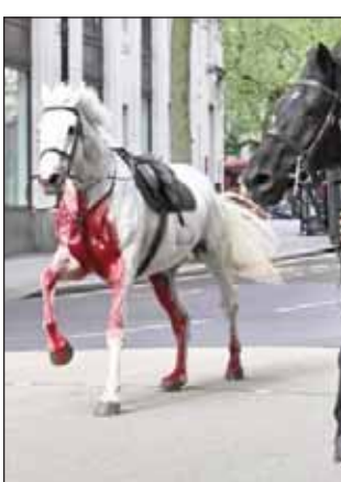
ਵਾਲੀ ਟੁਕੜੀ ਵਿੱਚ ਸ਼ਾਮਿਲ ਹਨ। ਸੈਂਟਰਲ ਲੰਡਨ ਦੇ ਐਲਡਵਿਚ ਰੋਡ 'ਤੇ ਘੋੜੇ ਦੌੜ ਰਹੇ ਸਨ, ਜਿਸ ਕਾਰਨ ਉੱਥੇ ਟ੍ਰੈਫਿਕ ਜਾਮ ਹੋ ਗਿਆ। ਘੋੜੇ ਇੱਕ ਡਬਲ ਡੈਕਰ

ਲੰਡਨ, 25 ਅਪ੍ਰੈਲ (ਪੋਸਟ ਬਿਊਰੋ) : ਬ੍ਰਿਟਿਸ਼ ਰਾਜਧਾਨੀ ਲੰਡਨ 'ਚ ਬੁੱਧਵਾਰ (24 ਅਪ੍ਰੈਲ) ਦੀ ਸਵੇਰ ਨੂੰ 5 ਘੋੜਿਆਂ ਨੂੰ ਸੜਕ 'ਤੇ ਬੇਤਰਤੀਬ ਦੌੜਦੇ ਦੇਖ ਕੇ ਲੋਕ ਹੈਰਾਨ ਰਹਿ ਗਏ। ਇਸ ਦੀ ਵੀਡੀਓ ਵੀ ਸੋਸ਼ਲ ਮੀਡੀਆ 'ਤੇ ਵਾਇਰਲ ਹੋ ਰਹੀ ਹੈ। ਕੁਝ ਘੋੜੇ ਜ਼ਖਮੀ ਵੀ ਸਨ। ਉਨ੍ਹਾਂ ਦੇ ਸਰੀਰ ਵਿੱਚੋਂ ਖੂਨ ਨਿਕਲ ਰਿਹਾ ਸੀ। ਲੋਕਾਂ ਨੇ ਤੁਰੰਤ ਇਸ ਦੀ ਸੂਚਨਾ ਪੁਲਿਸ ਨੂੰ ਦਿੱਤੀ। ਇਸ ਮਗਰੋਂ ਪੁਲਿਸ ਨੇ ਕਿਸੇ ਤਰ੍ਹਾਂ ਘੋੜਿਆਂ ਨੂੰ ਕਾਬੂ ਕਰਕੇ ਇਲਾਜ ਲਈ ਭੇਜ ਦਿੱਤਾ। ਬਾਅਦ ਵਿੱਚ ਪਤਾ ਲੱਗਾ ਕਿ ਇਹ ਸਾਰੇ ਘੋੜੇ ਬ੍ਰਿਟਿਸ਼ ਫੌਜ ਦੇ ਸਨ, ਜੋ ਸ਼ਾਹੀ ਪਰਿਵਾਰ ਦੀ ਸੁਰੱਖਿਆ ਸੰਭਾਲਣ