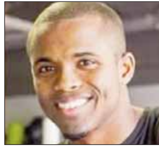
ਟੋਰਾਂਟੋ ਪੁਲਿਸ ਦਾ ਮੰਨਣਾ ਹੈ ਕਿ ਇਸ ਘਟਨਾ ਨੂੰ ਸੱਚ ਸਮਝ ਕੇ ਅੱਜਾਮ ਦਿੱਤਾ ਗਿਆ ਹੈ ਪਰ ਉਨ੍ਹਾਂ ਇਹ ਨਹੀਂ ਦੱਸਿਆ ਕਿ ਮ੍ਰਿਤਕ ਨੂੰ ਮਸ਼ਕੂਕ ਜਾਣਦੇ ਸਨ। ਜਾਂਚਕਾਰਾਂ ਨੇ ਦੱਸਿਆ ਕਿ ਮਸ਼ਕੂਕਾਂ ਨੇ ਮੂੰਹ ਢਕੇ ਹੋਏ ਸਨ ਤੇ ਕਾਲੇ ਰੰਗ ਦੇ ਕੱਪੜੇ ਪਾਏ ਹੋਏ ਸਨ। ਉਹ ਕਾਰੇ ਨੂੰ ਅੱਜਾਮ ਦੇਣ ਤੋਂ ਬਾਅਦ ਚਿੱਟੀ ਜਾਂ ਹਲਕੇ ਰੰਗ ਦੀ ਸੈਡਾਨ ਵਿੱਚ ਸਵਾਰ ਹੋ ਕੇ ਪਹਿਲਾਂ ਲਾਂਗ ਬ੍ਰਾਂਚ ਦੇ ਦੱਖਣ ਵੱਲ ਗਏ ਤੇ ਫਿਰ ਲੋਕ ਸੌਰ ਬੁਲੇਵਾਰਡ ਦੇ ਪੱਛਮ ਵੱਲ ਚਲੇ ਗਏ।

ਟੋਰਾਂਟੋ, 25 ਅਪਰੈਲ (ਪੋਸਟ ਬਿਊਰੋ) : ਸਿਟੀ ਦੇ ਪੂਰਬੀ ਸਿਰੇ ਉੱਤੇ ਇੱਕ ਰਿਹਾਇਸ਼ੀ ਬਿਲਡਿੰਗ ਵਿੱਚੋਂ ਇੱਕ ਵਿਅਕਤੀ ਦੀ ਲਾਸ਼ ਮਿਲਣ ਤੋਂ ਬਾਅਦ ਟੋਰਾਂਟੋ ਪੁਲਿਸ ਦੀ ਹੋਮੀਸਾਈਡ ਯੂਨਿਟ ਵੱਲੋਂ ਮਾਮਲੇ ਦੀ ਜਾਂਚ ਕੀਤੀ ਜਾ ਰਹੀ ਹੈ। ਐਮਰਜੈਂਸੀ ਅਮਲੇ ਨੂੰ ਸਵੇਰੇ 11:00 ਵਜੇ ਮੌਰਨਿੰਗਸਾਈਡ ਐਵੇਨਿਊ ਨੇੜੇ ਲਾਐਰੈਂਸ ਐਵੇਨਿਊ ਈਸਟ ਉੱਤੇ ਸਥਿਤ ਬਿਲਡਿੰਗ ਵਿੱਚੋਂ ਮੈਡੀਕਲ ਸ਼ਿਕਾਇਤ ਮਿਲੀ। ਪੁਲਿਸ