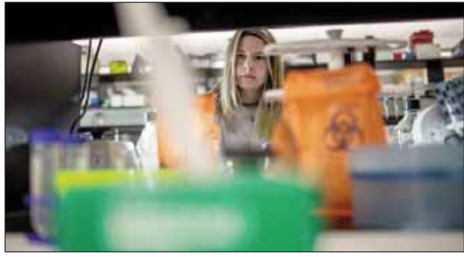
ਰਹੀਮੀ ਦੇ ਵੈਕਸੀਨ ਵਿੱਚੋਂ ਇਹ ਇੱਕ ਹੈ। ਵੀਡੋ ਨੇ ਮੰਗਲਵਾਰ ਨੂੰ ਆਖਿਆ ਕਿ ਉਸ ਨੂੰ ਹੈਲਥ ਕੈਨੇਡਾ

ਟੋਰਾਂਟੋ, 22 ਦਸੰਬਰ (ਪੋਸਟ ਬਿਊਰੋ) : ਸਸਕੈਚਵਨ ਵਿੱਚ ਤਿਆਰ ਕੀਤੀ ਗਈ ਕੋਵਿਡ-19 ਵੈਕਸੀਨ ਨੂੰ ਕੈਨੇਡਾ ਵਿੱਚ ਹਿਊਮਨ ਟ੍ਰਾਇਲ ਲਈ ਮਨਜ਼ੂਰੀ ਦੇ ਦਿੱਤੀ ਗਈ ਹੈ। ਇਸ ਦੇ 2021 ਦੇ ਅੰਤ ਤੱਕ ਤਿਆਰ ਹੋਣ ਦੀ ਸੰਭਾਵਨਾ ਹੈ।