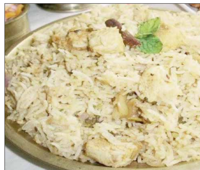
ਪਕਾਏ। ਹੁਣ ਲਖਨਵੀ ਪੁਲਾਅ ਤਿਆਰ ਹੈ। ਇਸ ਨੂੰ ਦਹੀਂ ਜਾਂ ਫਿਰ ਤੇਜ਼ ਮਿਰਚ ਵਾਲੀ ਚਟਣੀ ਨਾਲ ਮਹਿਮਾਨਾਂ ਅੱਗੇ ਪਰੋਸੋ।

ਸਮੱਗਰੀ-ਉ ਬਲੇ ਹੋਏ ਬਾਸਮਤੀ ਚੌਲ 250 ਗਰਾਮ, ਘਿਓ ਇੱਕ ਵੱਡਾ ਚਮਚ, ਉਬਲੇ ਹਰੇ ਮਟਰ ਅੱਧਾ ਕੱਪ, ਉਬਲੀ ਕੱਟੀ ਹੋਈ ਗਾਜਰ ਤੇ ਫਰੈਂਚ ਬੀਨਸ ਦੇ ਵੱਡੇ ਚਮਚ, ਕਾਜੂ, ਬਾਦਾਮ ਤੇ ਕਿਸਮਿਸ ਇੱਕ ਚੌਥਾਈ ਕੱਪ, ਪਿਆਜ਼ (ਸਲਾਈਸ 250 ਗਰਾਮ, ਕਸੂਰੀ ਮੋਢੀ-ਇੱਕ ਛੋਟਾ ਚਮਚ, ਜੀਰਾ ਅੱਧਾ ਛੋਟਾ ਚਮਚ, ਦਾਲਚੀਨੀ ਪਾਊਡਰ, ਛੋਟਾ ਅੱਧਾ ਚਮਚ, ਗਰਮ ਮਸਾਲਾ ਇੱਕ ਛੋਟਾ ਚਮਚ, ਪਨੀਰ (ਛੋਟੇ ਟੁਕੜਿਆਂ ਵਿੱਚ ਕੱਟਿਆ) 100 ਗਰਾਮ, ਨਮਕ ਸਵਾਦ ਅਨੁਸਾਰ। ਵਿਧੀ- ਇਸ ਨੂੰ ਬਣਾਉਣ ਲਈ ਤੁਸੀਂ