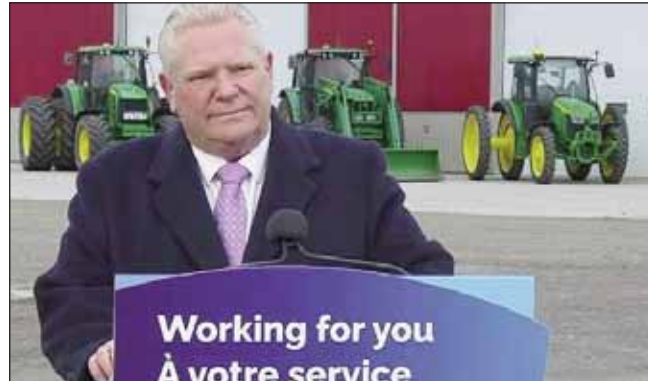
ਉਨ੍ਹਾਂ ਸਾਰਿਆਂ ਨੇ ਵਾਰੀ ਵਾਰੀ ਟਰੂਡੋ ਸਰਕਾਰ ਦੇ ਇਸ ਫੈਸਲੇ ਦੀ ਨਿਖੇਧੀ ਕੀਤੀ ਤੇ ਦੱਸਿਆ ਕਿ ਇਹ ਕਾਰਬਨ ਟੈਕਸ ਕਿਵੇਂ ਕਾਰੋਬਾਰ ਤੇ ਕੰਜ਼ਿਊਮਰਜ਼ ਨੂੰ ਆਖਿਆ ਕਿ ਇਸ ਨਾਲ ਹੋਰ ਕੁੱਝ ਨਹੀਂ ਮਹਿਸੂਸ ਕੀਤਾ ਜਾਵੇਗਾ। ਪ੍ਰੀਮੀਅਰ ਫੋਰਡ ਨੇ ਸਿਰਫ ਟਰੂਡੋ ਨੂੰ ਹੀ ਲੋਮੋਂ ਹੱਥੀ ਨਹੀਂ ਲਿਆ ਸਗੋਂ ਉਨ੍ਹਾਂ ਓਨਟਾਰੀਓ ਦੀ ਲਿਬਰਲ ਆਗੂ ਬੋਨੀ ਕ੍ਰੋਬੀ ਉੱਤੇ ਵਰ੍ਹਿਆਂ ਉਨ੍ਹਾਂ ਨੂੰ ਕਾਰਬਨ ਟੈਕਸ ਦੀ ਮਹਾਰਾਣੀ ਦੱਸਿਆ।

ਓਨਟਾਰੀਓ, 2 ਅਪਰੈਲ (ਪੋਸਟ ਬਿਊਰੋ) : ਮੰਗਲਵਾਰ ਨੂੰ ਫੈਡਰਲ ਸਰਕਾਰ ਦੇ ਕਾਰਬਨ ਟੈਕਸ ਦੀ ਨੁਕਤਾਚੀਨੀ ਕਰਦਿਆਂ ਪ੍ਰੀਮੀਅਰ ਡੱਗ ਫੋਰਡ ਨੇ ਆਖਿਆ ਕਿ ਜਾਂ ਤਾਂ ਸਰਕਾਰ ਨੂੰ ਇਹ ਟੈਕਸ ਹਟਾਉਣਾ ਹੋਵੇਗਾ ਤਾਂ ਜਾਂ ਫਿਰ ਪ੍ਰਧਾਨ ਮੰਤਰੀ ਜਸਟਿਨ ਟਰੂਡੋ ਦੀ ਇਸ ਵਾਰੀ ਛੁੱਟੀ ਹੋਵੇਗੀ। ਇਸ ਸਮੇਂ ਫੋਰਡ ਦੇ ਨਾਲ ਸੋਮਵਾਰ ਤੋਂ ਲਗੂ ਹੋਣੇ ਵਾਲੇ ਕਾਰਬਨ ਟੈਕਸ ਦੀ ਗੱਲ ਕਰਦਿਆਂ ਫੋਰਡ ਨੇ ਆਖਿਆ ਕਿ ਜੇ ਟਰੂਡੋ ਇਸ ਕਾਰਬਨ ਟੈਕਸ ਨੂੰ ਵਾਪਸ ਨਹੀਂ ਲੈਂਦੇ ਤਾਂ ਜਦੋਂ ਵੀ ਅਗਲੀਆਂ ਫੈਡਰਲ ਚੋਣਾਂ ਹੋਣਗੀਆਂ ਤਾਂ ਟਰੂਡੋ ਨੂੰ ਵੋਟਰਾਂ ਦੇ ਗੁੱਸੇ ਦਾ ਸਾਹਮਣਾ ਕਰਨਾ ਹੋਵੇਗਾ।