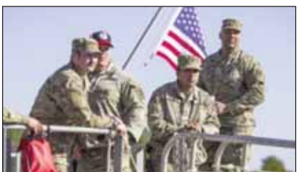
ਬੇਸ ਵਿੱਚ ਦਾਖਲ ਹੋਇਆ ਸੀ, ਛੱਡਣ ਦੇ ਆਦੇਸ਼ਾਂ ਨੂੰ ਨਜ਼ਰਅੰਦਾਜ਼ ਕੀਤਾ ਸੀ। ਨਿਊਯਾਰਕ ਪੋਸਟ ਨੇ ਰਿਪੋਰਟ ਦਿੱਤੀ ਹੈ ਕਿ ਯੂਐੱਸ ਮਰੀਨ ਕੋਰ ਦੀ ਟ੍ਰੇਨਿੰਗ ਅਤੇ ਐਜੂਕੇਸ਼ਨ